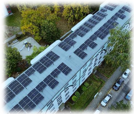
- Dach Moosstraße -

groß, und auch der angebotene Preis von 26 Cent pro Kilowattstunde ist ein überzeugendes Argument.